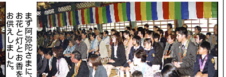
まず阿弥陀さまに、お花と灯とお香をお供えしました。