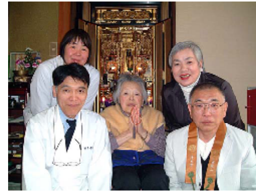
浜田 割烹「横田」さん宅 お母さんを中心に長男、次男夫婦揃ってご縁に遇われました。

昨年十一月より、ご門徒一軒一軒のご家庭で報恩講を迎えています。 どのご家庭も、精いっぱいのお迎えをされます。 そのお気持がお仏壇のお荘厳等を通して伝わってきます。