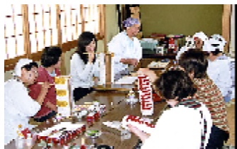
11対のだんごのお供えを数日間かけて作成します。今年も和木地区のお同行の皆さんのご報謝により、素敵なお荘厳が完成しました。